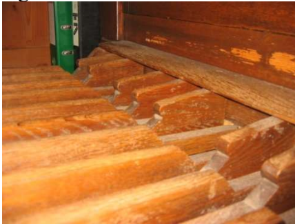
Golvende vorm in de boventoetsen van het pedaal