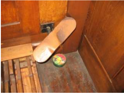
Trede voor het inschakelen van Prestant 8' en Prestant 4'.