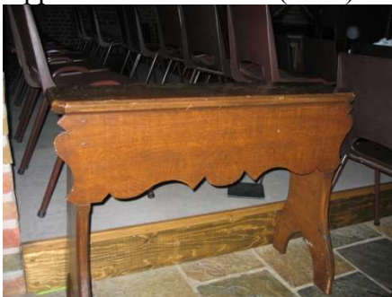
Rond gezaagde welvingen in de orgelbank