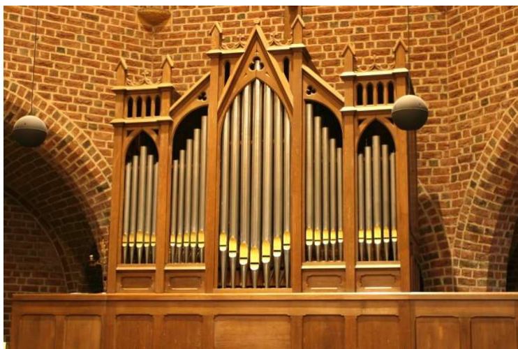
Neo - gotische kas