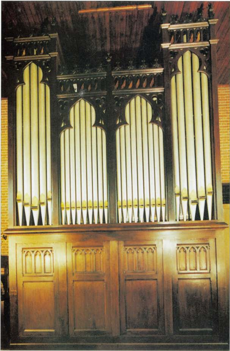
Restauratie Gradussen-orgel H. Willibrorduskerk Drempt